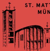
ST. MATTHÄUS MÜNCHEN