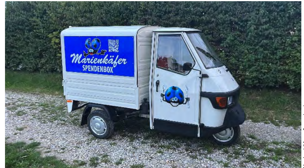
Marienkäfer - Spendenbox

Doch zuerst gibt es immer für alle etwas zu Essen und zu Trinken und anschließend benötigte Kleidung.